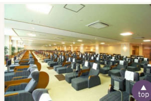
男女別休憩室（漫画あり）