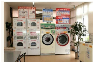
テルメ金沢駐車場のコインランドリー ※洗剤・柔軟剤は自動投入のため不要